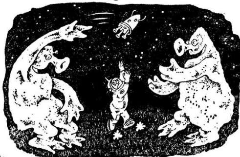
Рисунки С. АШМАРИНА.