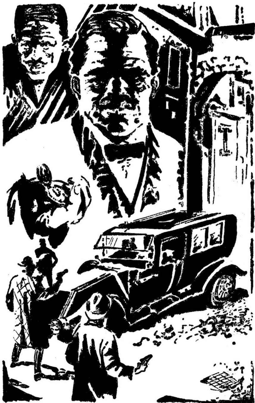
Художник Т. ЗЛОКАЗОВА.